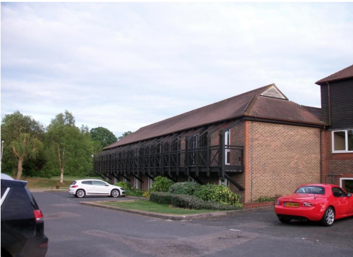
Hotel in Maaidstone / England