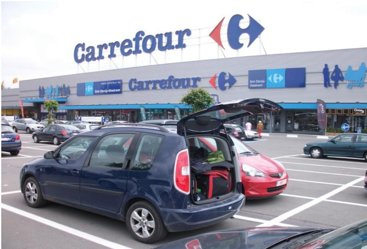
Belgien an der Autobahn