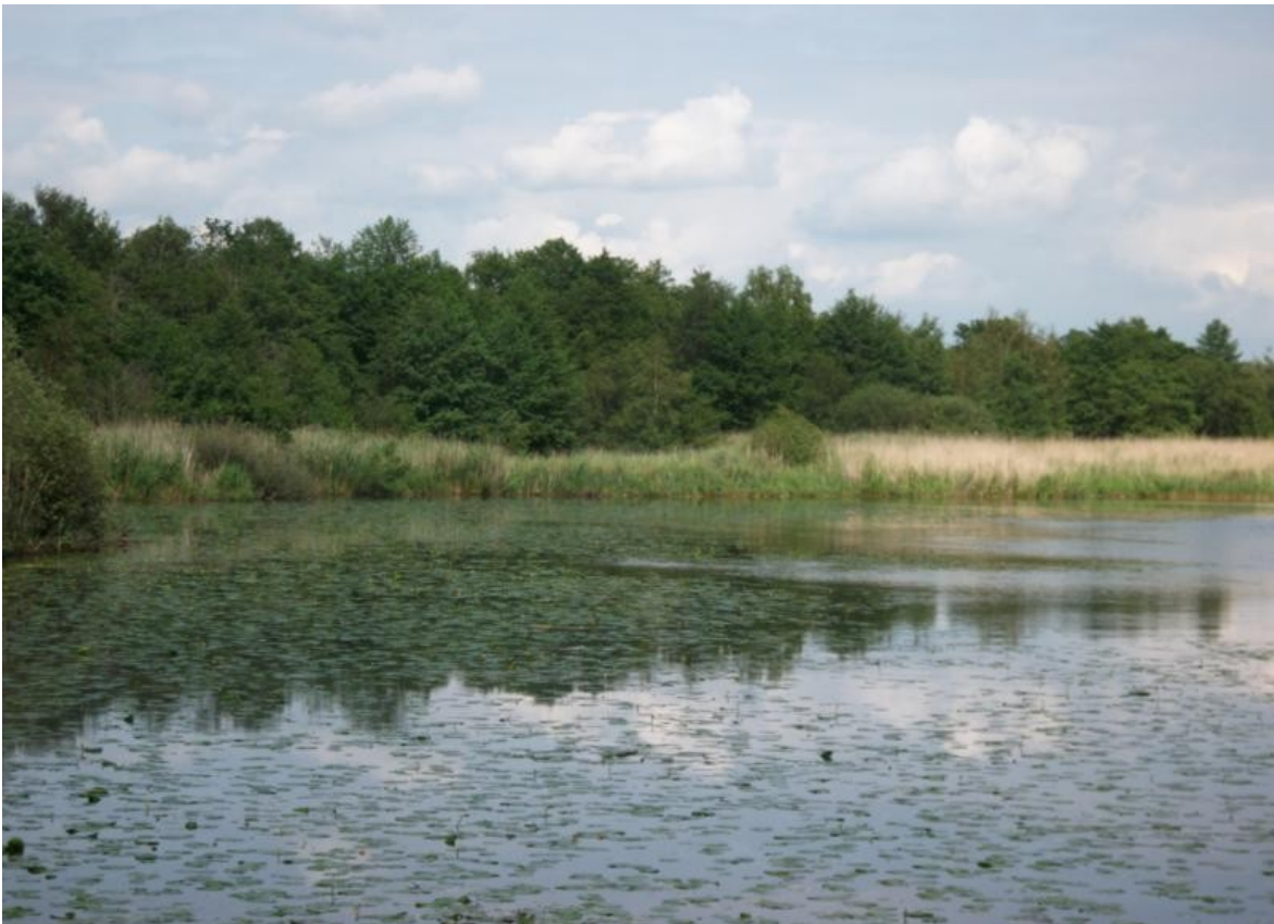
Neustadt a.Rbge. / Mardorf / Nordufer / neuer Turm / Beginn des Toten Moores Ende der Reise / Ende der Bilderserie