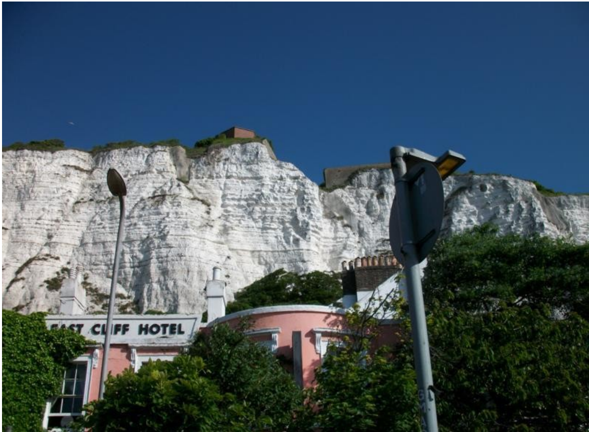
Dover / England