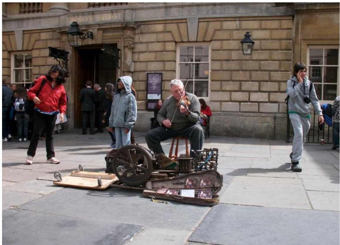
Bath / Basis für die Fußbodenheizung / Musiker vor dem Eingang des Römerbades