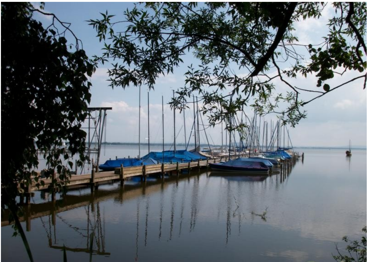
Mardorf / Nordufer / Neue Moorhütte