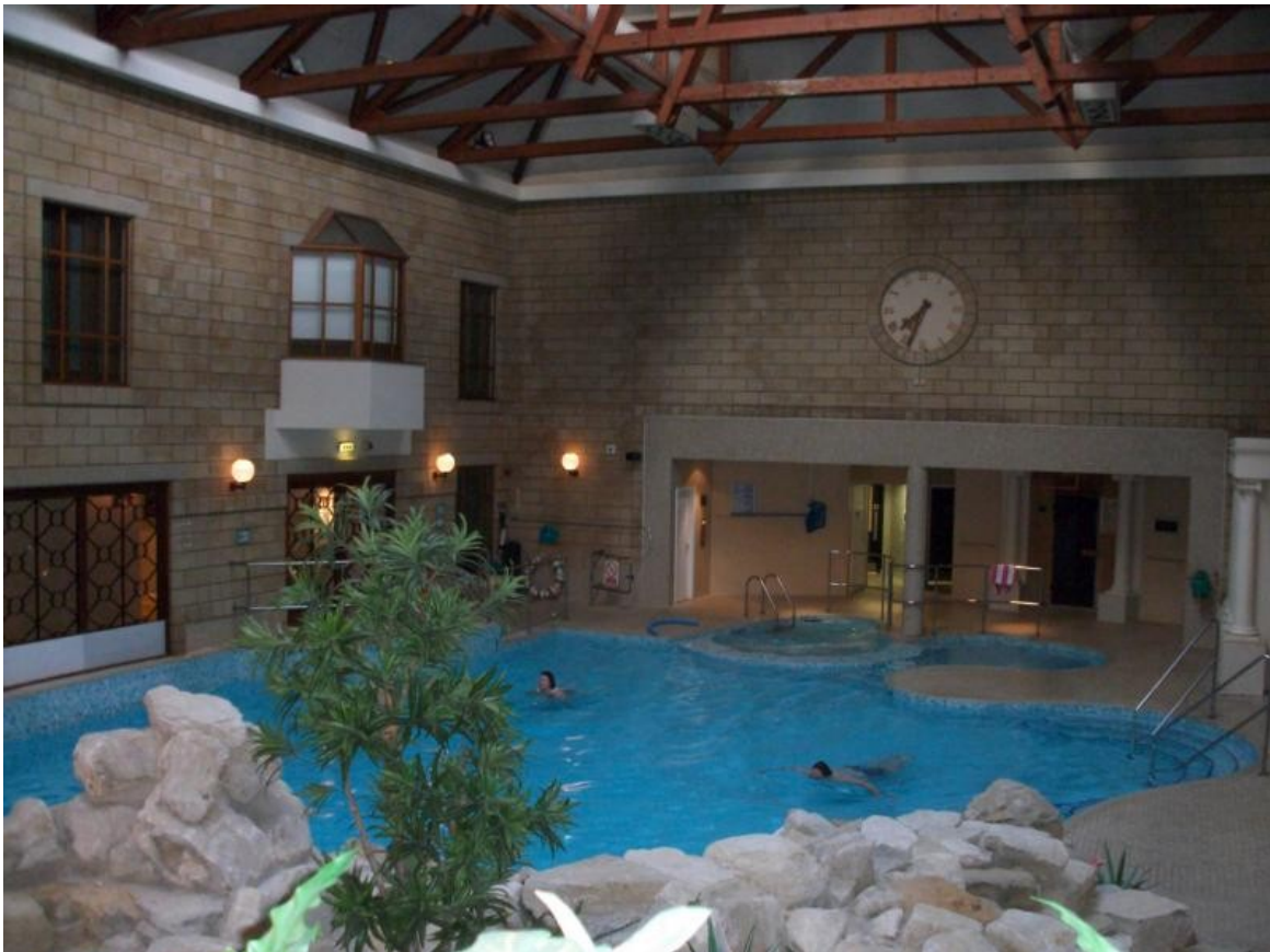
Hotel in Maaidstone / Ende