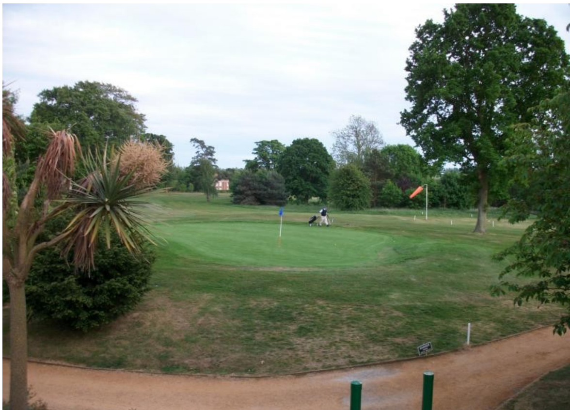
Maaidstone / Hotel mit Golfplatz