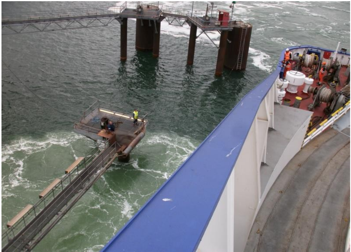
Dünkirchen / Ende