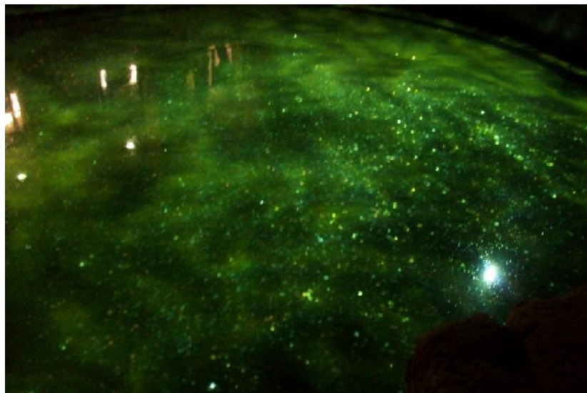
Bath / alter Quellenkanal und Wasserbecken mit Münzen