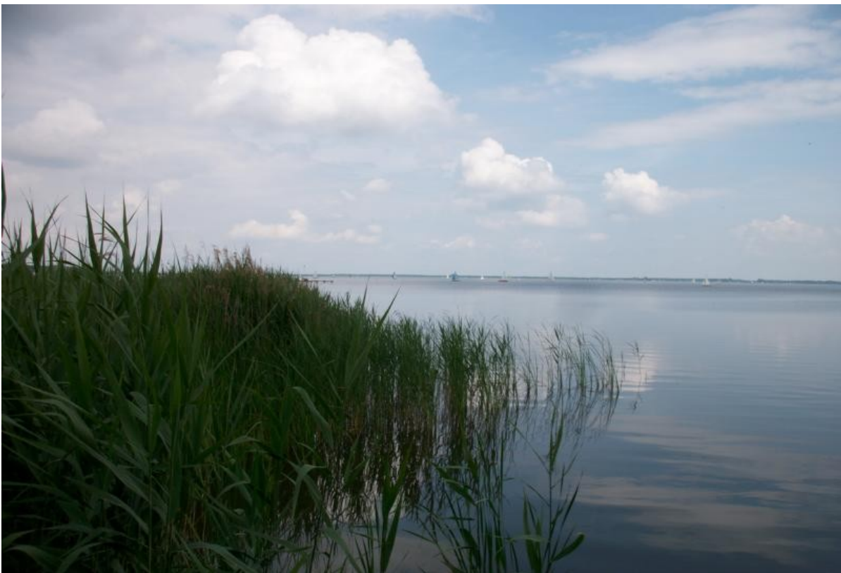
Steinhuder Meer / Nordufer / Mardorf