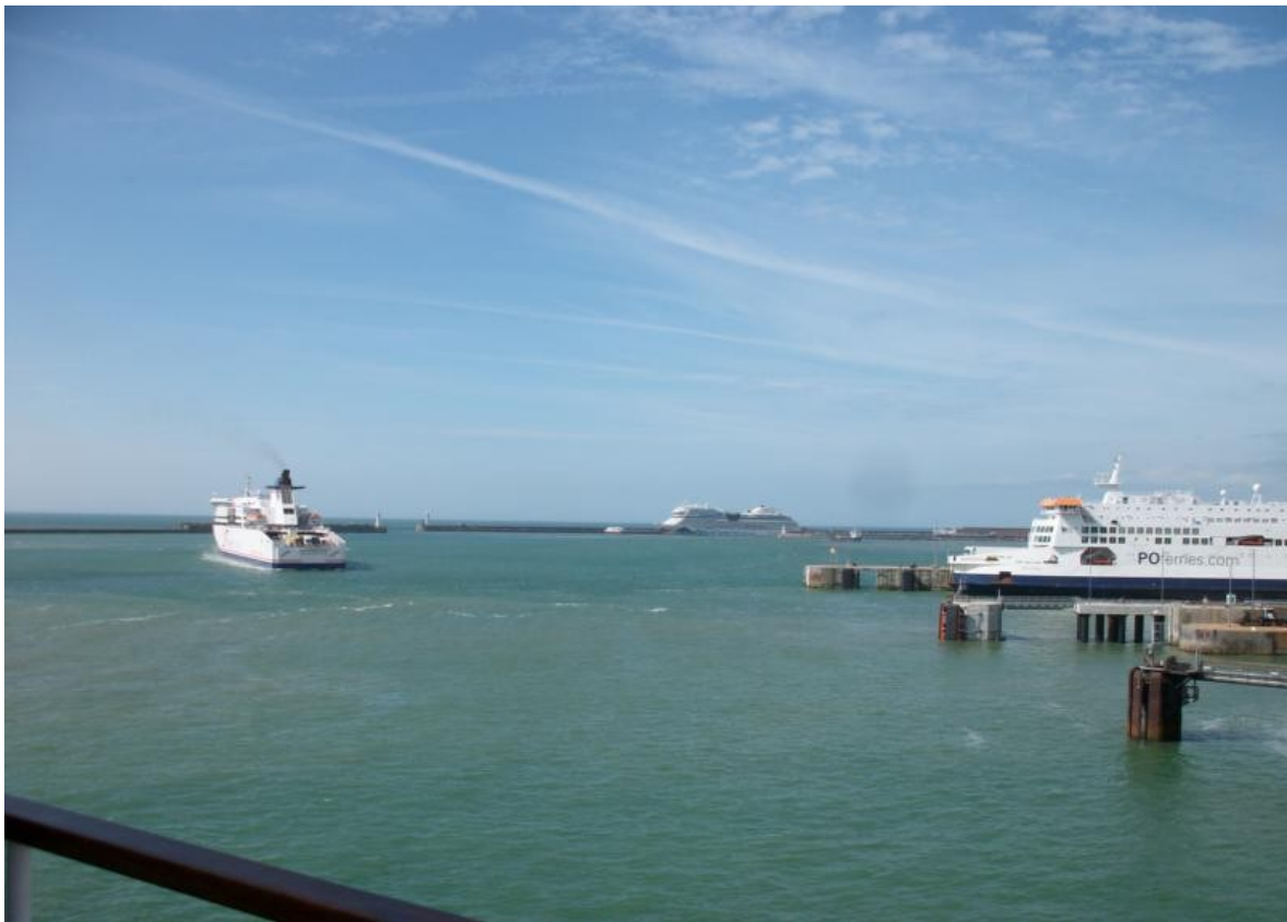
Dover / Ende