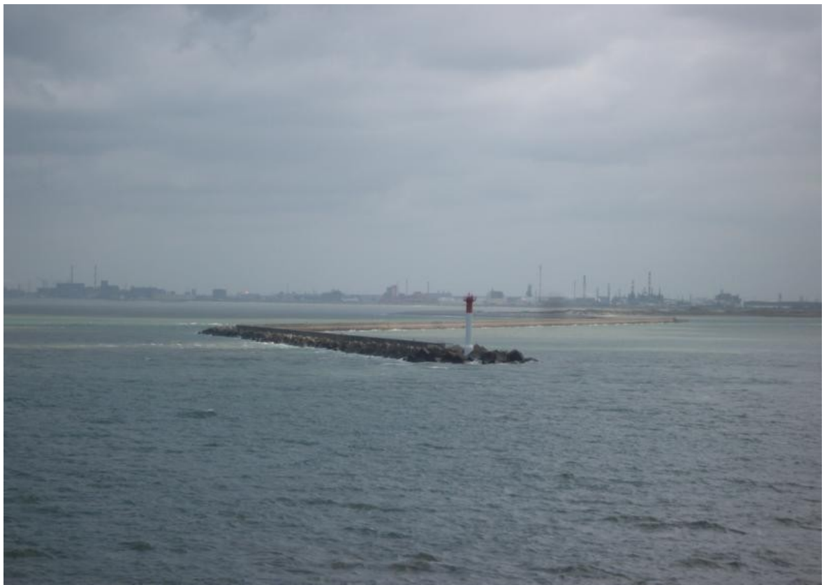
Dünkirchen / Frankreich