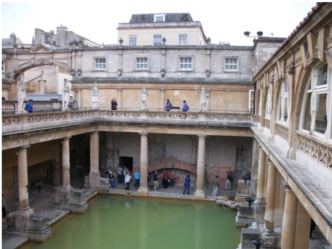
Bath / Musiker mit kalten Händen und zugeteilter Zeit / das Hauptbad mit aufgesetzter Balustrade