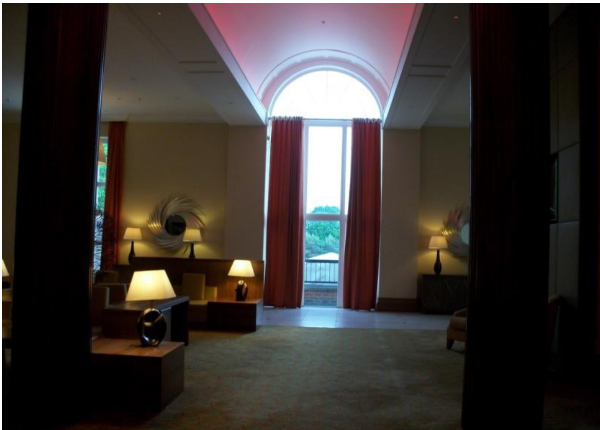
Hotel in Maaidstone