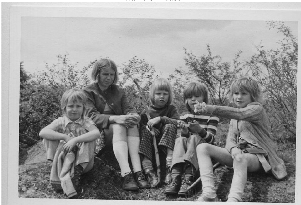
Meine erste Familie im Mai 1975 in Altenahr in der Nähe von Walkers Klause