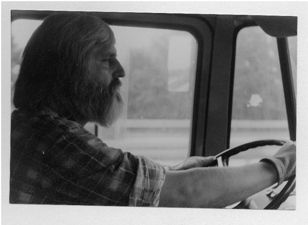
T.A. Auf der Rückfahrt von Altenahr nach Mardorf, fotografiert von Ekkehard Lindner im Juni 1975. (Die Hauptfracht des LKW bestand im Material für das volkswirtschaftliche Planspiel von Karl Walker, das leider nicht zum Einsatz kam.)